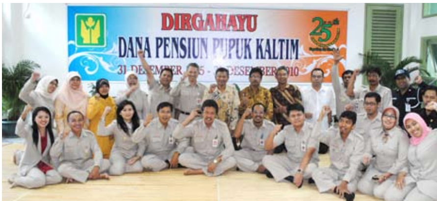
Foto Bersama Direksi, Karyawan dan Pengurus P3KT Kalimantan usai syukuran dan upacara HUT ke 25 tgl 31 Desember 2010

Kegiatan hiburan dan doorprize menjadi bagian penutup dalam rangkaian kegiatan peringatan Hari Ulang Tahun ke 25 Dana Pensiun Pupuk Kalimantan Timur.