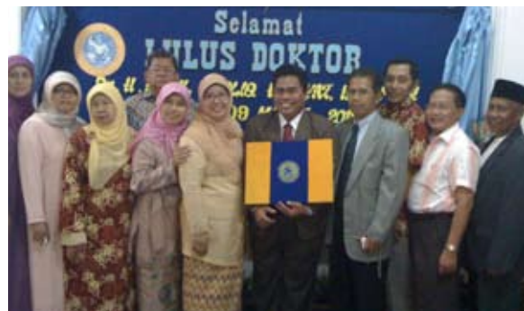
Foto Bersama dengan rekan Pensiunan Saat Pengukuhan Doktor