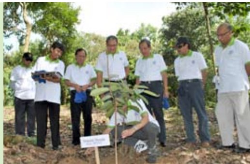
Ketua KOMDA VII/Direktur Utama DP-PKT melakukan Penanaman Pohon di Wana Wisata Bontang

Kegiatan Go Green dalam rangka HUT ke 25 Asosiasi Dana Pensiun Indonesia untuk KOMDA VII Kalimantan dipusatkan di Wana Wisata PT Pupuk Kaltim Bontang dan telah dilaksanakan pada tanggal 4 November 2010 yang