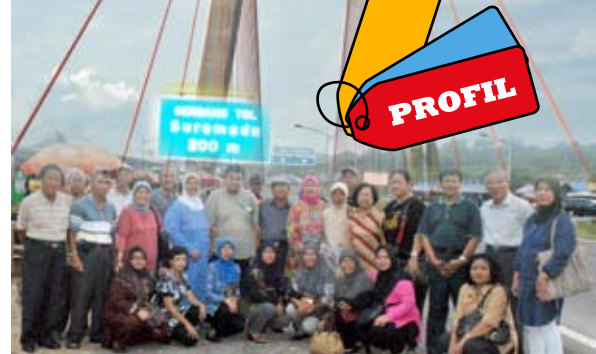
Keluarga besar P3KT Yogyakarta dan Jawa Tengah saat rekreasi ke Suramadu tanggal 16 Oktober 2010.

yatim piatu, yatim, piatu dan dhuafa, dimiliki oleh pria kelahiran Mojokerto tanggal 25 Mei 1946. Hingga saat ini beliau tetap sehat dan eksis dan mewarnai dunianya dengan kegiatan sosial di wilayah Jogjakarta, karena terus mendapatkan dukungan dan support dari Pemda setempat serta sejumlah donatur.